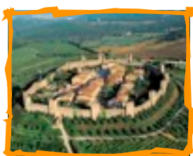
I borghi medievali